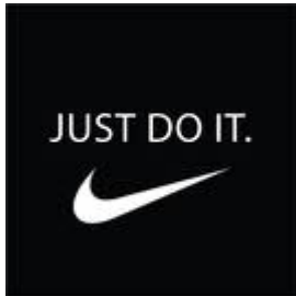
Benelux aanvraag 1162579

Slagzinnen als merk zijn weer helemaal hot. Na de uitspraak van het Europese Hof in de zaak VORSPRUNG DURCH TECHNIK, laten nu ook de Benelux autoriteiten van zich spreken.